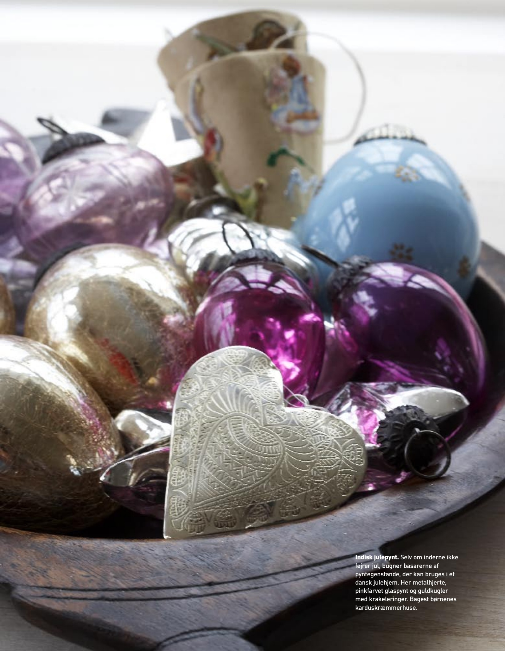
Indisk julepynt. Selv om inderne ikke fejrer jul, bugner basarerne af pyntegenstande, der kan bruges i et dansk julehjem. Her metalhjerter, pinkfarvet glaspynt og guldkugler med krakeleringer. Bagest børnenes karduskræmmerhuse.